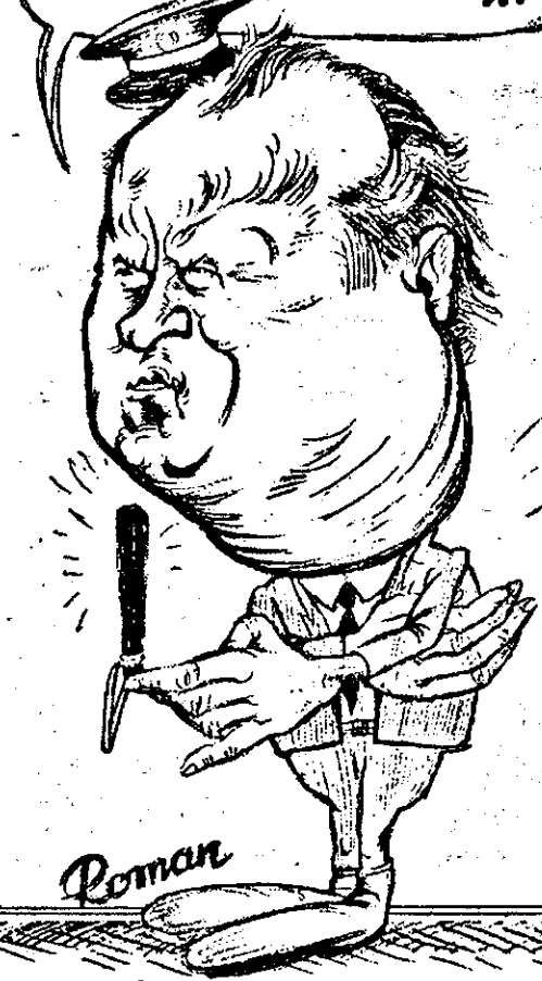
În ultimul timp rata infracționalității a crescut foarte mult.

-POLITIA-I CA O INIMĂ; CÂND NU BATE, E DE RAI !!!