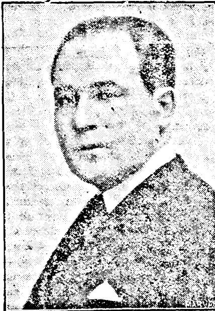
D. MITIȚĂ CONSTANTINESCU, Min. de Finanțe