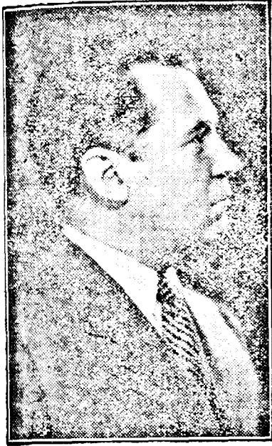
D. VICTOR IAMANDI, Min. de Justiție

Pilda aceasta este o cinste pentru Justiția noastră și ea arată că toate se pun, odată cu ritmul nou, pe drumul cel bun către care trebuie să se îndrepte toată țara, ca să putem să ne numim cu tot dreptul țară civilizată a veacului al XX-lea.