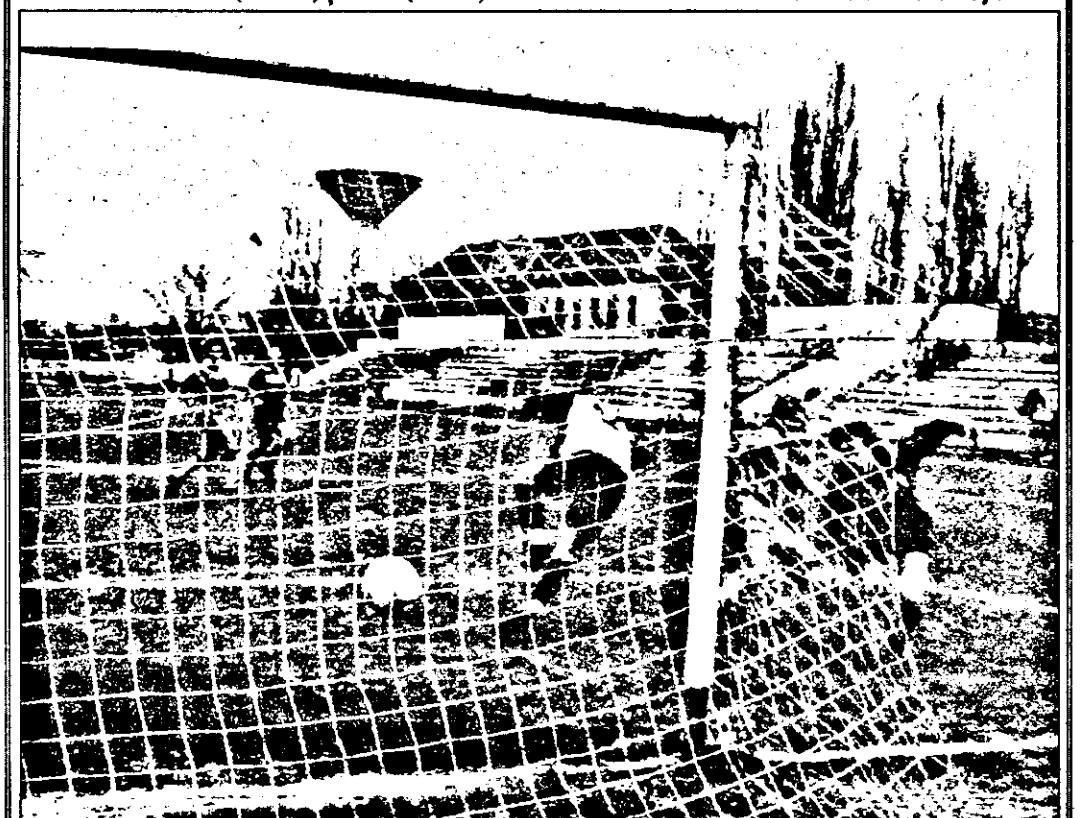
Ștefăligă (primul din dreapta) înscrie cu capul, deschizând scorul. Fază din meciul Astra - Laminorul Zalău 2-0.