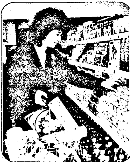
Total este extraordinar. Ce să-mi cumpăr oare?

Complexul alimentar are și un program deosebit de altele de profil din Arad: zilnic 7,00 - 21,00, sâmbăta 7 - 15, iar