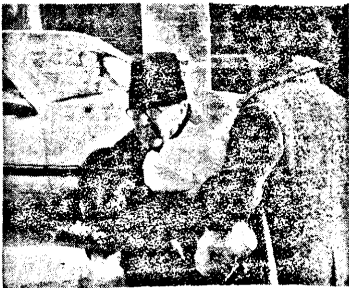
Au apărut ghiocci. Cit ar fi de gingași, sînt și ei sursă de venituri!