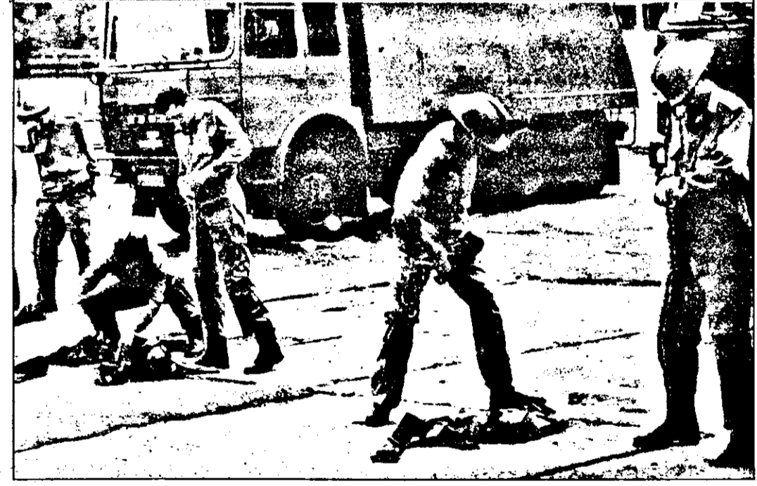
S-a dat semnalul „ALARMĂ”. Fiecare secundă contează, chiar dacă te afli la... instrucție...