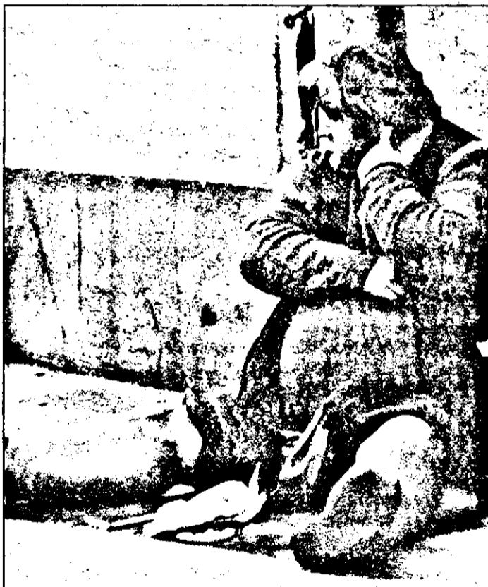
Până-i Primăria-n floare, nici asfaltul nu-i prea tare!