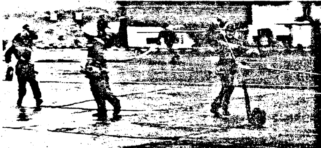
... Și ... exercițiul a început! Cu o așa... rapiditate că și aparatul de fotografiat s-a ... lăsat impresionat.

Să sperăm că aceste succinte considerente vor fi primite de către toate primăriile și consiliile locale din teritoriul județului Arad, fără idei preconcepute și subiectivism înguste și prost înțelose! Căci a distruge e foarte ușor, dar să nu uităm că - în caz de nevoie - pompierii constituie o mână de ajutor dezinteresată, dar oferită cu toată răspunderea!