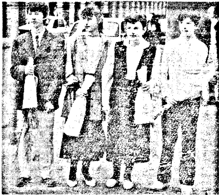
Bucuria este imensă. Sînt noii absolvenți — absolvenții Revoluției. Pășesc cu încredere în viitor.