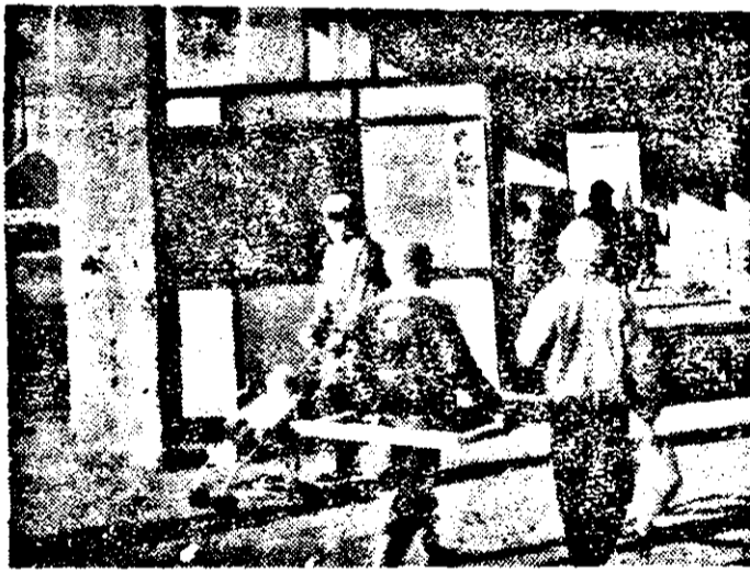
Cea de a treia - trasă par-că la indigo - a fost am-plasată tot într-un pasaj de trecere: cel din fața complexului comercial Șega de pe Calea Aurel Vlaicu. La să