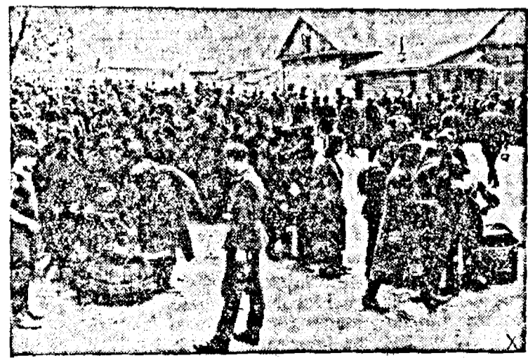
INTR'UN LAGAR DE PRIZONIERI SOVIETICI

Am desprins aceste rânduri din sorile celor ce scriu către cei care tă pentru Sfânta Cruce și biruința mului românesc, în dorința de a na pe răboiul faptelor încă o însușie aleasă a celor rămași acasă, căci nimic mai folositor pentru Patrie frumos pentru Neam în timpul războiului, decât munca fără precepere a lor din spatetele frontului și cuvintele lor de îmbăbătare către soldații niți în lupte pentru apărarea credințestrămosești și a hotarelor Țării lor.