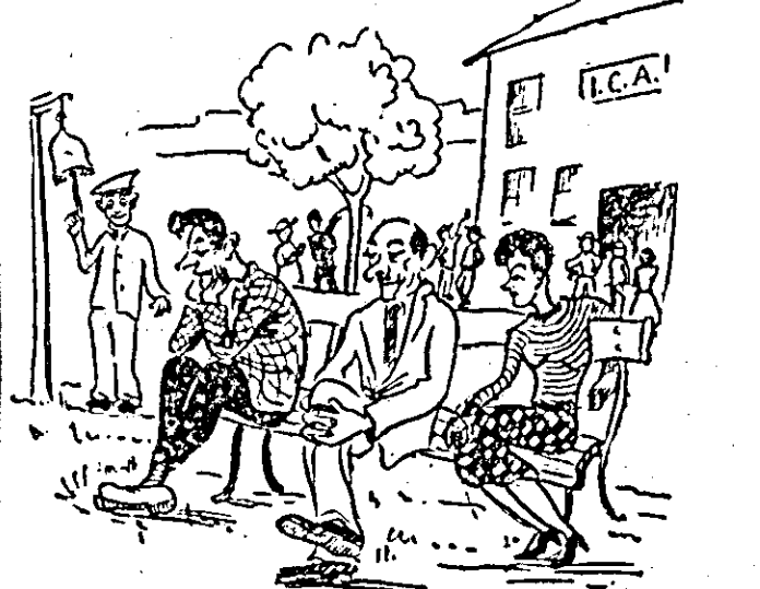
A început munca tovarășii! — Nu ne deranja, vezi doar că... sîntem prezenți.

Unii funcționari de la I.C.A. nu folosesc din plin cele 8 ore de muncă. După începerea lucrului, dimineața, iar după masă înainte de încetarea muncii, discută în fața porții sau stau pe bancă cuprînși de gânduri. La suplimentul satiric al gazetei de perete a apărut o caricatură pe această temă.