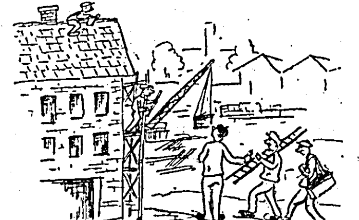
ECHIPA DE REPARAȚII: Terminați o dată, tovarășii construcția că vrem să reparăm.

Calitatea lucrărilor de construcții, executate de întreprinderea 129 construcții, la fabrica „Teba”, lasă mult de dorit. Caricatura de mai jos satirizează superficialitatea de care dă dovadă această întreprindere în executarea construcțiilor.