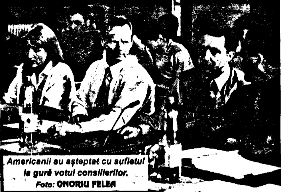
Americanii au așteptat cu sufletul la gură votul consilierilor.

◆ Potrivit asocierii cu CLM, CENTURYMARC-SUA va investi 200 milioane de dolari ◆ Municipiului Arad îi revine 10 la sută din profitul CET ◆ Până atunci CLM a majorat, din nou, prețul giga-caloriei