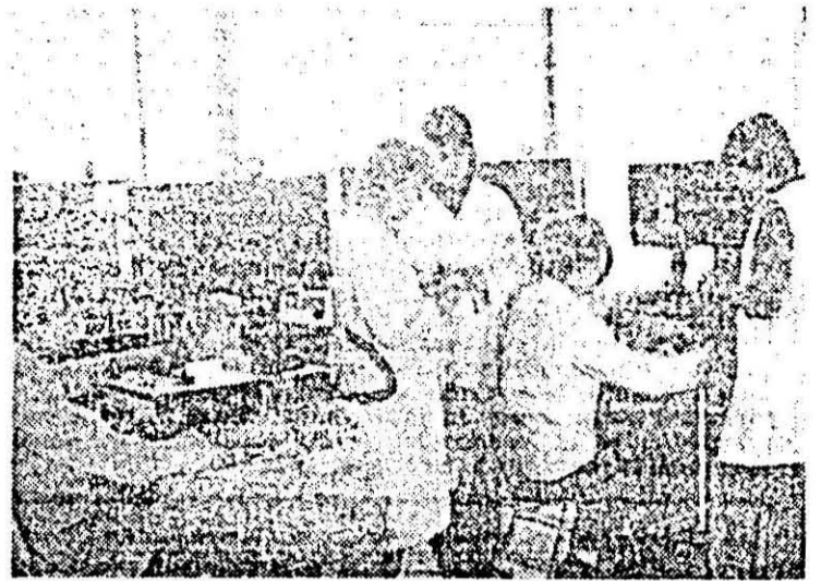
Tinerii de la Întreprinderea de orologerie industrială se apleacă mereu în primele rânduri în lupta pentru realizarea unor produse de înaltă calitate.