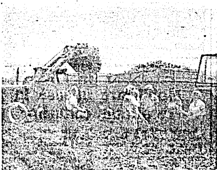
La C.A.P. Mallat, sfecla de zahăr recoltată este transportată operativ la destinație.