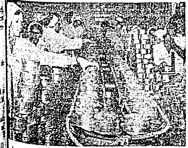
La I.P.I.L.F. „Refacerea” se lucrează intens la conservarea produselor.