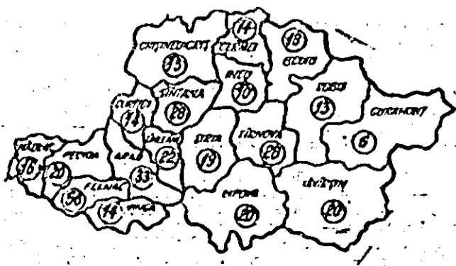
Stadiul însămînțării porumbului în consiliile unice agroindustriale din județ, plan în seara zilei de 8 aprilie 1984 (în procente față de plan).