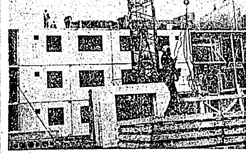
În noul cvartal de locuințe din Calea Aurel Vlaicu.

produsa în valoarea de milioane de lei și pînă la cca. 300 000 lei penalități de întîrziere către organizațiile comerciale sînt numai o parte din consecințele economice rezultate în urma nerespectării obligațiilor contractuale. Cu toate acestea, conducerea fabricii, în mod nejustificat, nu și-a valorificat decît în mică măsură dreptul său de a pretinde penalități și despăgubiri pentru prejudiciile cauzate, inclusiv beneficii nerecizitate, ca urmare a nerespectării contractelor de către furnizorii săi.