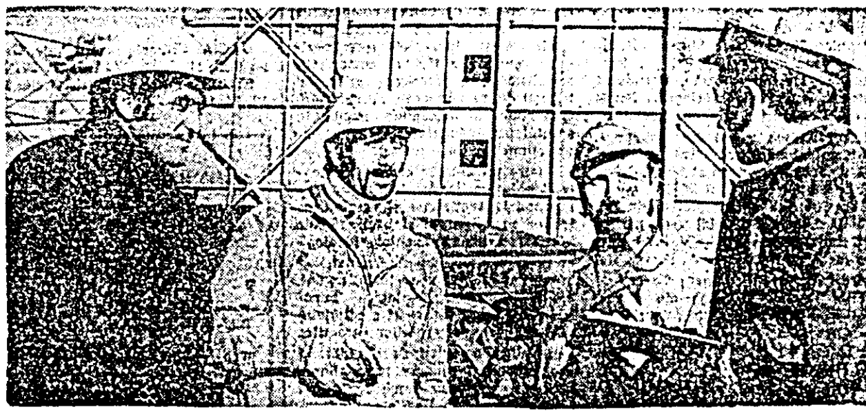
Pe șantierul Combinatului de îngrășăminte chimice, instructorul cu protecția muncii îi acordă toată atenția, el desigurîndu-se la lucrurile de muncă, cu exemplificări practice.