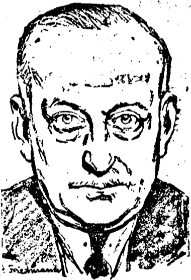
PRIMO DE RIVERA.