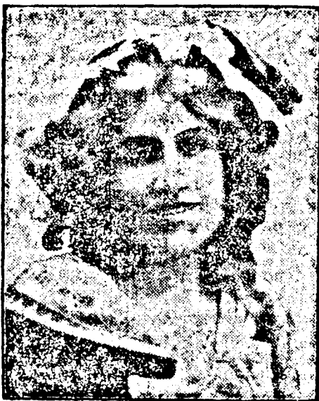
A híres operanékesnő, mint az megirtuk, Budweisban 52 éves korában szívszélhűdés következtében váratlanul elhunyt.