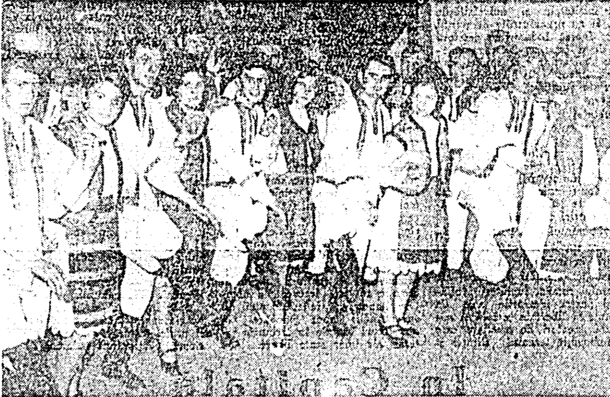
Formația de dansuri a clubului CFR interpretînd un frumos dans popular pe scena cîminului cultural din Vinga.