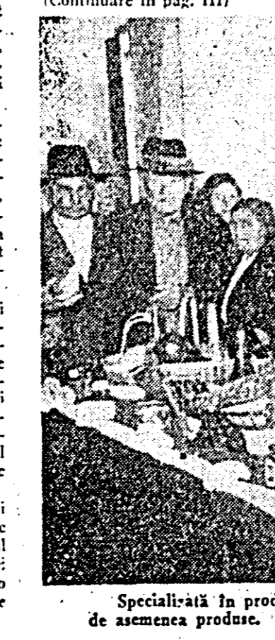
Specializată în producția de legume, GAS Fintinele a prezentat o bogată expoziție cu tot felul de asemenea produse.