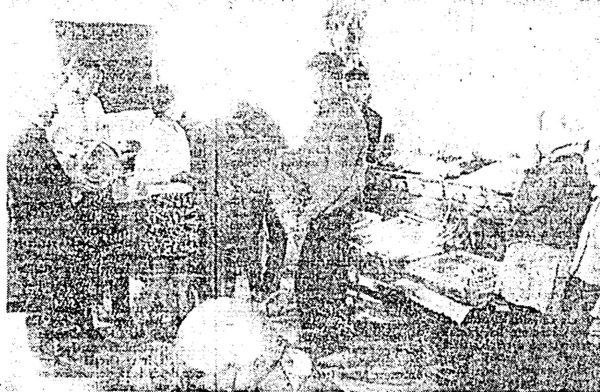
Cooperatorii din Mailat au adunat la expoziție, ca la o paradă a roadelor, tot ce produc ei în cursul anului, de la grâu, porumb și pină la ardei, ceapă și altele produse.