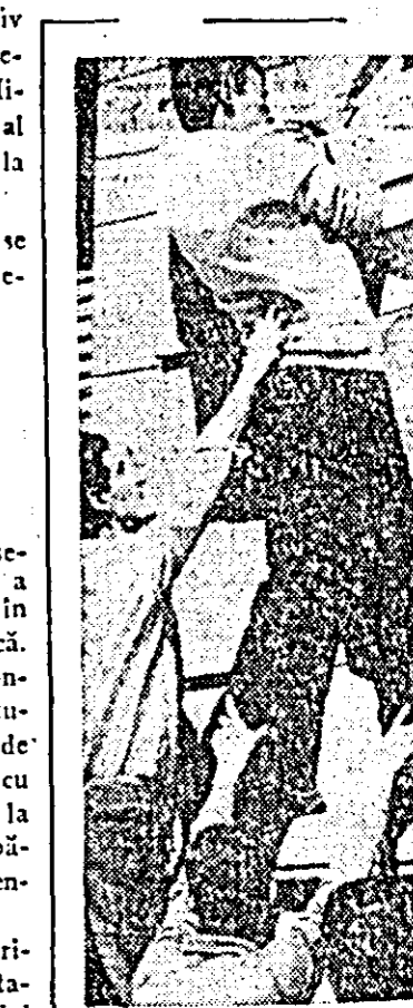
„Argentina: — La Cordoba, în semn de ultim omagiu din partea lui recent omorât de trupele guvernamentale, studenții schimbă denumirea străzii unde a produs asasinatul în strada „Santiago Pompllon”.

ciko, vicepreședinte al Consiliului de Miniștri al U.R.S.S., N.Y. Faddeev, secretar al CAER, și alte persoane oficiale.