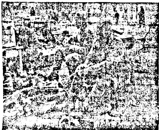
Prizonierii sârbi la Salonic, așteptând imbarcarea

V. PAUSEȘTI ȘI COMP. ARAD, BULEV. REG. MARIA