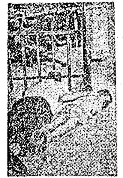
La Da Nang (Vietnamul de sud) trupele saigoneze au asaltat pagoda Tin Hol centrul de rezistență al budiștilor și studenților.

În vechea capitală imperială, Hue, continuă ciocnirile dintre populație și trupele guvernamentale. Mii de oameni au demonstrat vineri pe străzile orașului, informează agenția UPI, cerînd plecarea americanilor din Vietnamul de sud și demiterea