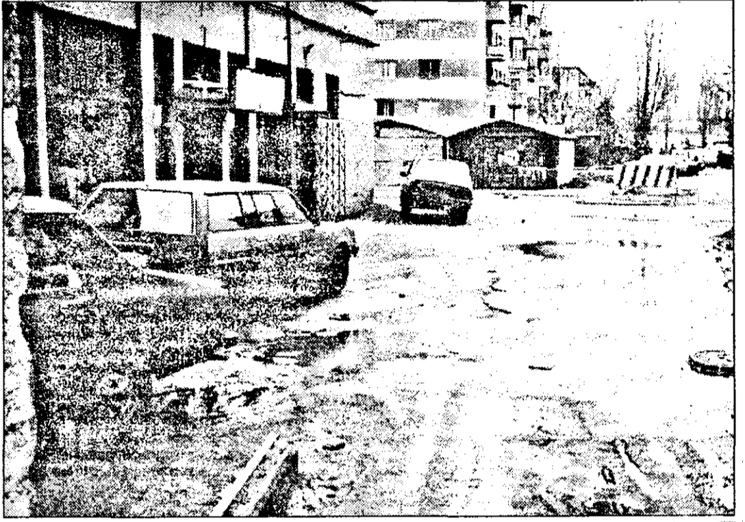
O imagine care vorbește de la sine despre cum înțeleg unii să-și facă treaba.

Spunem toate acestea deoarece nu este păcat ca uncle realizări și renumele pe care a început să și-l câștige Primăria să fie umbrite de asemenea fapte și mentalități?!