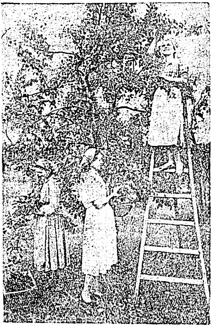
De mult n-au mai rodit pomi ca în anul acesta. Crengile sînt acuite sub greutatea fructelor. Culesul lor nu va fi o treabă chiar așa de ușoară cum înclină unii să creadă. IN CLIȘEU: la GAS Uvintș se culeg prunele.