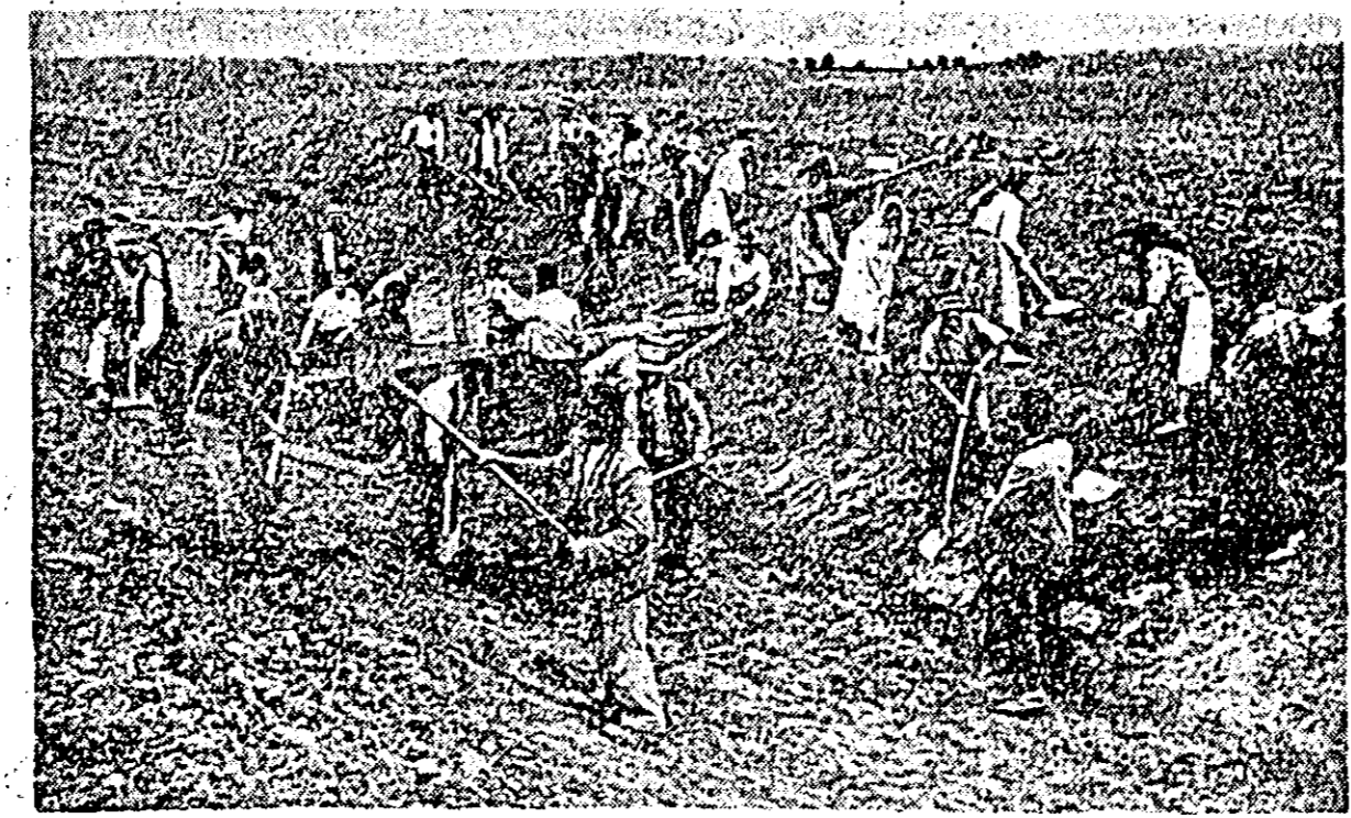
Nici întovărășiișii din Curtici nu s-au dat înapoi de la participarea la lucrările pe șantierul Mataca-Ier. Porțiunea pe care lucrează întovărășiișii este în mare parte terminată. Șantierul arată că mai este nevoie de finisări la mizeriile canalului. IN CLIȘEU: întovărășiișii din Curtici în timpul lucrului la canal.

rescu, Zimandul Nou, Zădăreni. Toate aceste gospodării au recoltat întreaga suprafață planificată pentru prima etapă. Pe raion s-a strîns sfecla de zahăr de pe 262 ha, mai mult decît s-a planificat pentru prima etapă.