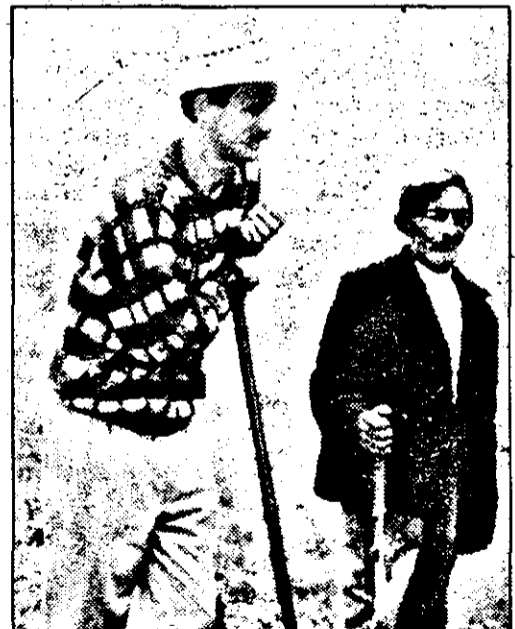
„Guleșii” din Șimand nu sunt de acord cu cei care spun că nu-i greu să fii văcar...