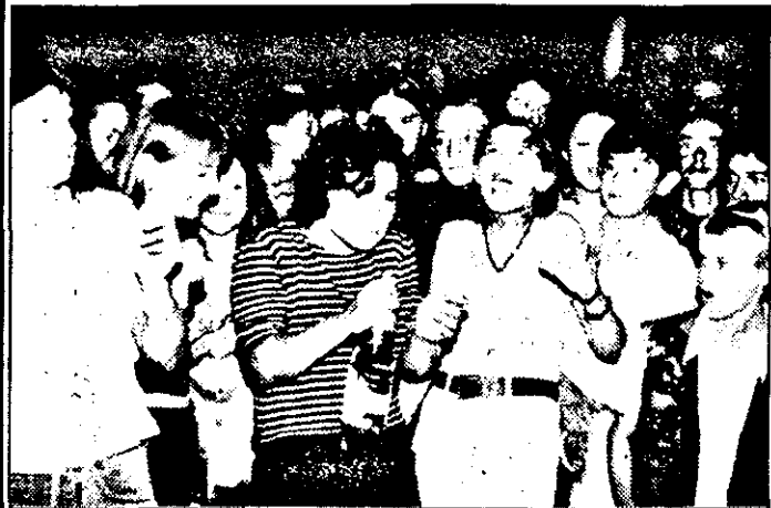
Sâmbătoare fără șampanie nu există!

trăită la intensitatea maximă, dans dezlănțuit... Toate acestea fiind caracteristicile unui Top 5 organizat de Departamentul Tineret al ziarului „Adevărul”. A trecut, veți spune. Nu-i adevărat, amintirile frumoase din noaptea de sâmbătă vor rămâne pentru o viață.