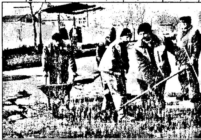
Străzii INDEPENDENȚEI i-a venit rândul la... cărpeală!