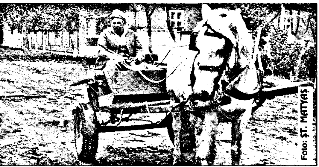
Vehicul de... austeritate