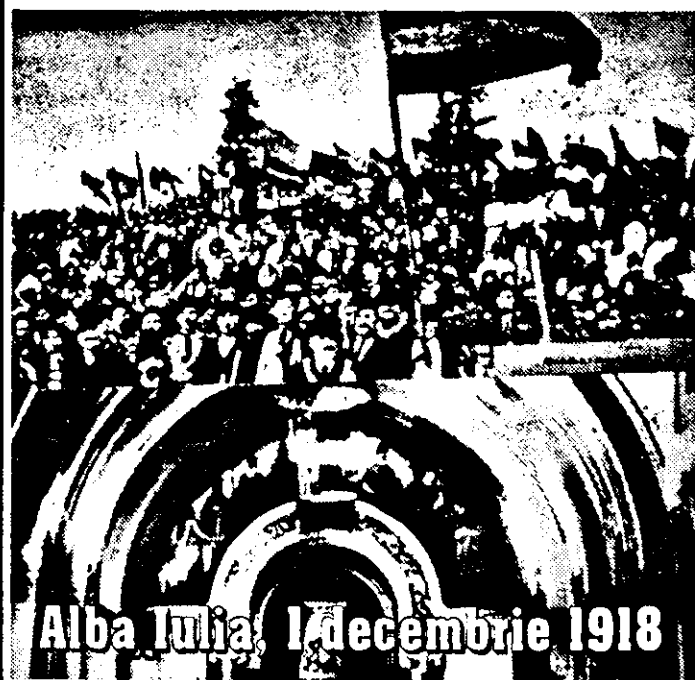
Alba Iulia, 1 decembrie 1918

În prima jumătate a anului 1918, când se întrezărea deja înfrângerea totală a puterilor centrale și imperiul habsburgic mergea vertiginos spre dezmembrare, apăsătoare mai împede ca niciodată inevitabilitatea eliberării popoarelor aflate sub stăpânirea acestuia.