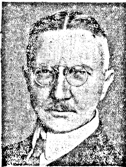
Dr. HJALMAR SCHACHT

a fényképezészek pergőtüze elé került, mosolyogva megjegyezte: