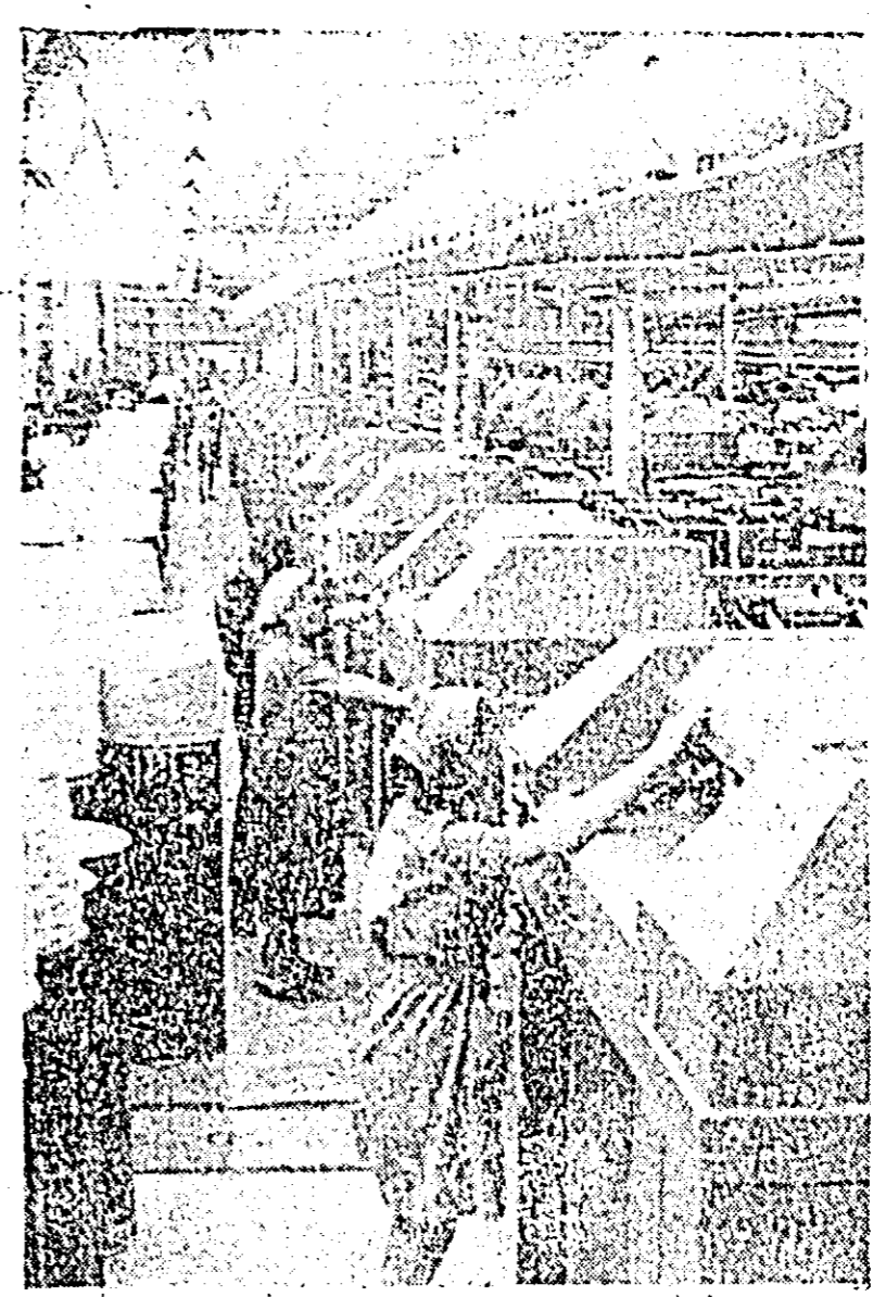
Industria textilă, puternic reprezentată în județul nostru de către unitățile combinatului textil, a cunoscut an de an noi realizări în domeniul mecanizării și automatizării proceselor de muncă. În CLISEU: una din halele unității „30 Decembrie” în care funcționează modernele mașini automate de laminare.