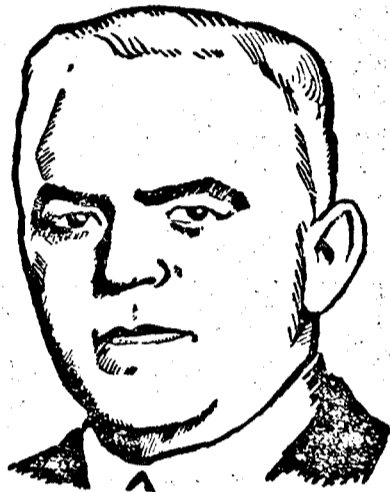
Dr. Groza Péter miniszterelnök

A gazdasági törvények becületesszándékal minden kétségem fejtől állnak, de semmiestre sem könnyű feladatot megbirkózni a reakciós szabotázsalkalmazásával. Itt eljuttatunk ahhoz a kérdéshez: „Mi nem változott még meg és miért nem változott meg?” A reakció, amely támadja a kormányt és igyekszik semmibevenni az elért eredményeket, mindent elkövet, hogy meggyőzze az újépítés munkáit. A történelmi reakció befolyása alatt álló magánkezelésnek ma is távol tartja magát ettől a munkától. A bratonszta liberális nagytőke a Banca Româneascăban tartalékok millióit, a helyett, hogy ezt a pénzt a munkásokhoz fektetné. A történelmi reakció többi nagy vállalatja is megmaradtak a nyitott vagy zárt szabotázs állásnőntján. Ilyen ké-