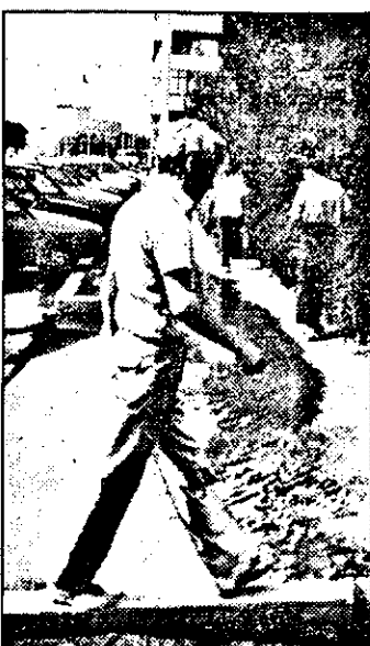
Ca să ajungi la trotuarul din fața blocului A-9 de pe Calea Aurel Vlaicu - și chiar după aceea - trebuie să faci o adevărată echilibristică datorită apei care a rupt din trotuar și care bălțește zile întregi datorită infundării, de ani de zile, (!) a canalelor de scurgere.