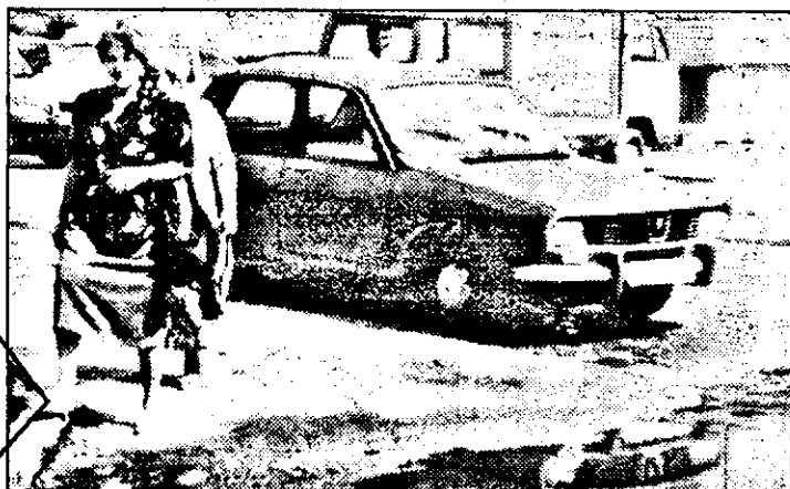
Așa arată intrarea din-spre șosea a cochetei Piețe agroalimentare „Fortuna” din Calea Aurel Vlaicu. Nu e păcat?