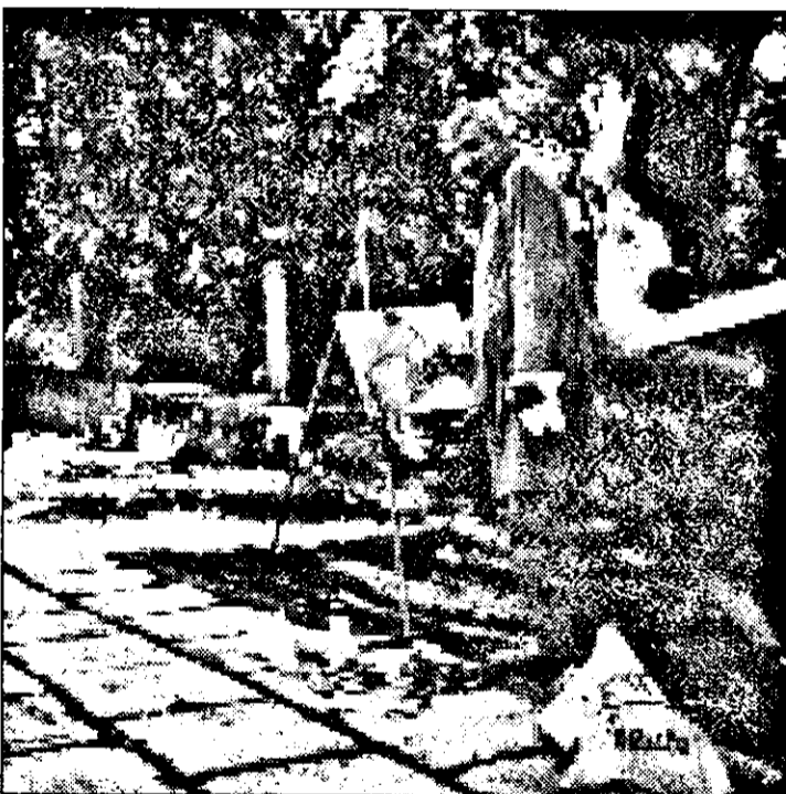
Pictor în peisaj

Duminică, 25 august, pe la ora 10, tot la muzeul din Siria, va avea loc vernisajul expoziției de pictură a taberei de la Siria, ediția 1996. Ediția 1996, pentru că, după cum veți vedea, vor avea loc și altele. PETRU M.HAȘ