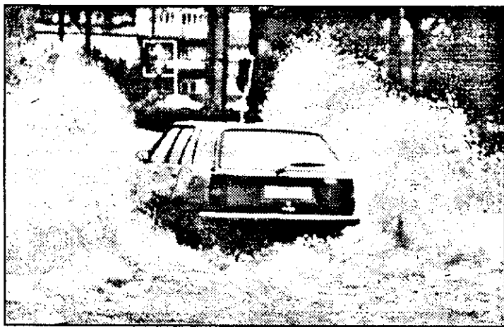
O imagine de coșmar pentru orice automobilist, luată în dreptul stației PECO de la Podgoria.