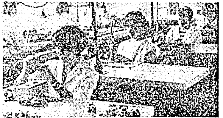
Aspect de muncă în secția montaj a întreprinderii de orologerie industrială.

S-a relevat rolul deosebit de important ce revine parlamentelor și parlamentarilor în întărirea colaborării și conlucrării internaționale, pentru soluționarea constructivă a marilor probleme ale contemporaneității, pentru afirmarea unei politici noi, de destindere, înțelegere și pace între națiuni.