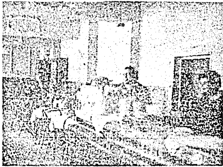
La parterul unuia din cele mai noi blocuri din Lipova funcționează braseria „Intim”, unitate modernă, caracterizată printr-o servit civilizată.