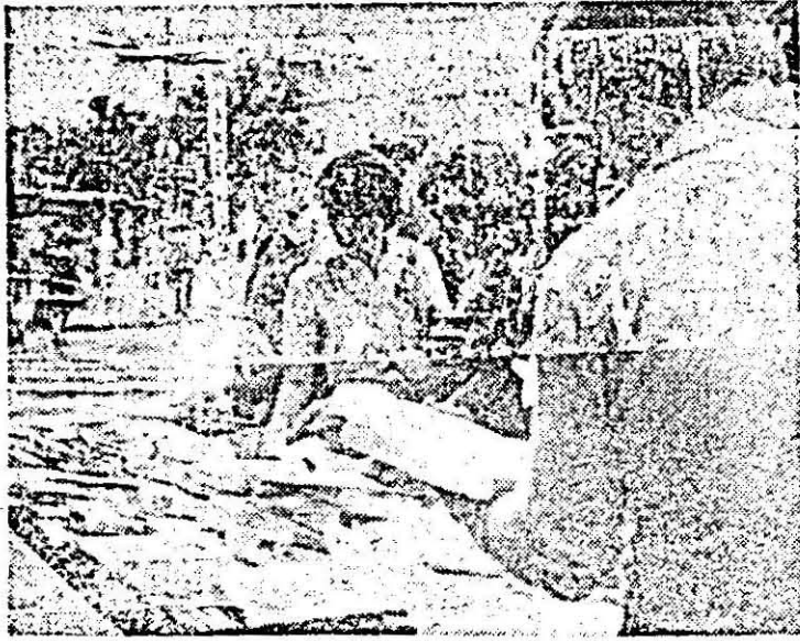
Imagine a comerțului sau a culturii? Oricum Standul de carte rămîne un simbol al nestăvilitii sete a înțelepciunii!