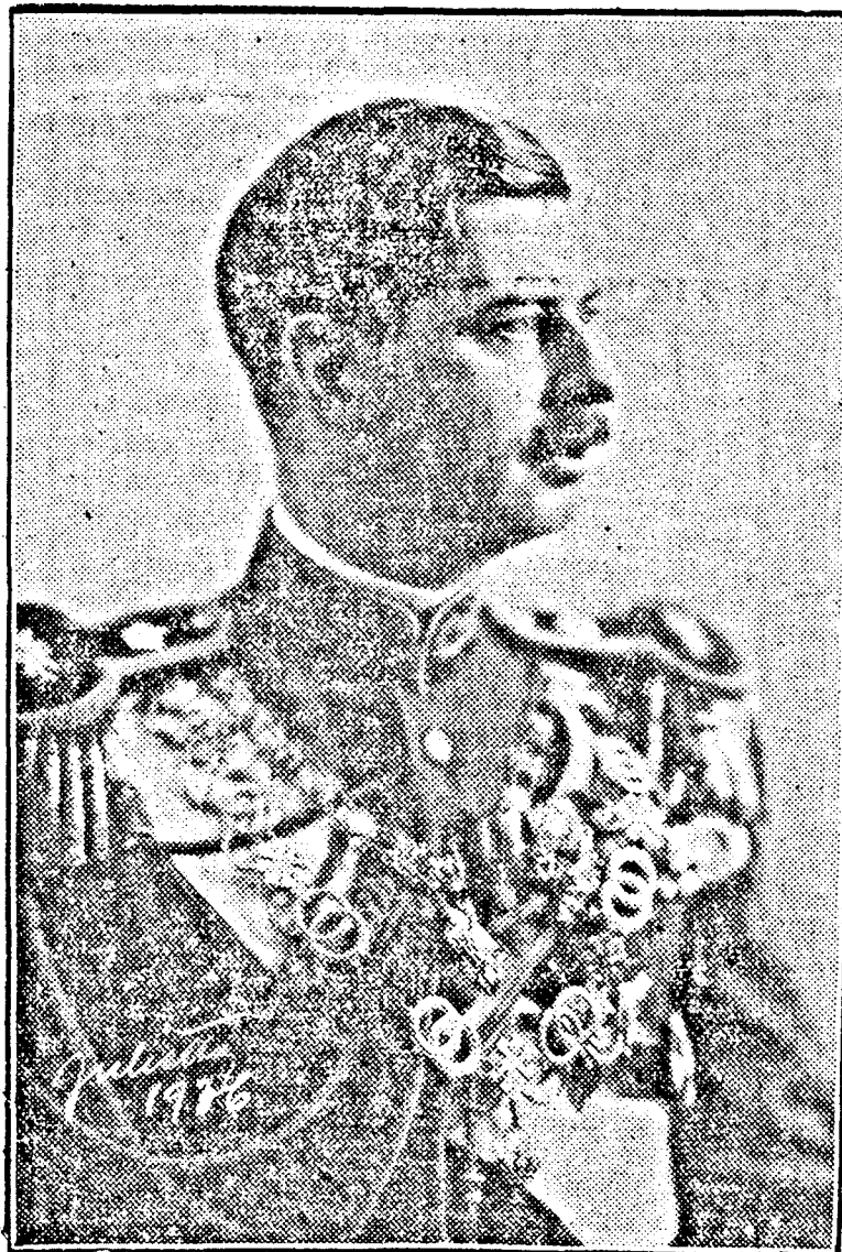
A ÖFELSÉGE II. CAROL KIRÁLY

Az uralkodó különvonata csütörtök reggel 8 óra 40 perckor érkezik meg Glogovai—Glogovácra. A vonat itt 10 óra 15 percig vesztegel. A Glogovai—glogováci állomáson csendőrkülönimény sorakozik fel és ez tartja fenn a rendet, ügyelve arra, hogy az uralkodót ne há-