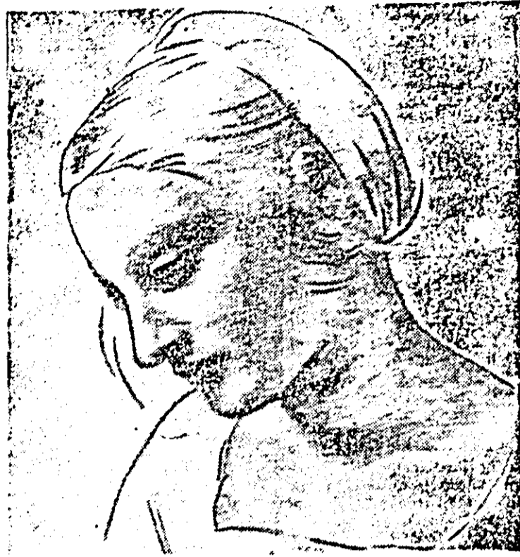
Schiţă de portret la „Madona Litta” de Leonardo da Vinci.