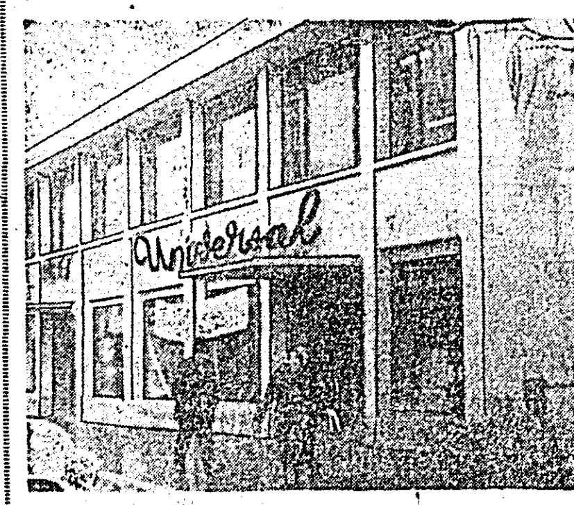
Clădiri noi, moderne întregesc în fiecare an peisajul orașelor din județul nostru. ÎN FOTOGRAFIE: magazinul universal din orașul Curtici.