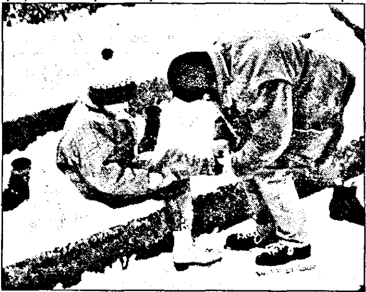
Prima lecție de patinaj...