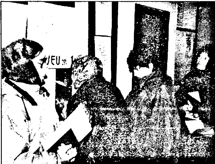
Șomerii se perindă zilnic pe holurile Direcției muncii și protecției sociale. Însă cei mai mulți nu vin pentru a-și căuta un loc de muncă ci... pentru obținerea vizei pe carnetul de șomaj.

Pentru săptămâna în curs, muncitor necalificat (1, șomer), șofer (1, șomer), turnător materiale neferoase (3), mecanic auto (2), șef atelier auto (2), barman (7), agent comercial (1), confecționar încălțăminte (15), cizmar (15), richtuitor (30), marochiner (5), vânzător (2), instalator sanitar (1), sudor electric și autogen (1), agent publicitar (20), bobinator motoare electrice (5), vânzător ambulant (2), femeie de serviciu (1).