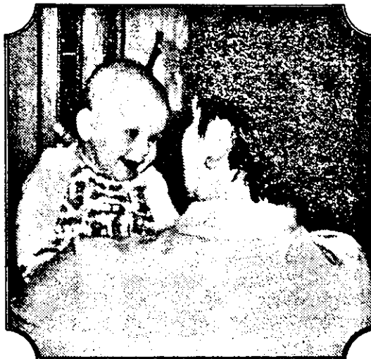
„Prințesa Leagănului” pare fericită. Oare atunci când va ști să vorbească ne-o va și spune? Sau...

Se pare că românii nu adoptă copii fiindcă le lipsește curajul. Mai există, în plus, și o doză de egoism care-i împinge pe fiecare să nu poată iubi pe cineva străin. Iată, însă, că nu toți sunt la fel. Chiar o infirmieră din Leagăn a adoptat un copil, o fetiță de patru ani,