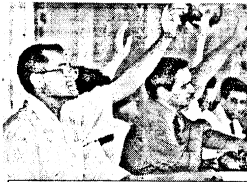
Vot unanim pentru ce-o fi!

mice, plus două momente (!) ale primarilor din Vrșet (Iugoslavia) și Gyula (Ungaria). Dacă totul, pe gratis sau nu, mai rămânea să stabilească consilierii.