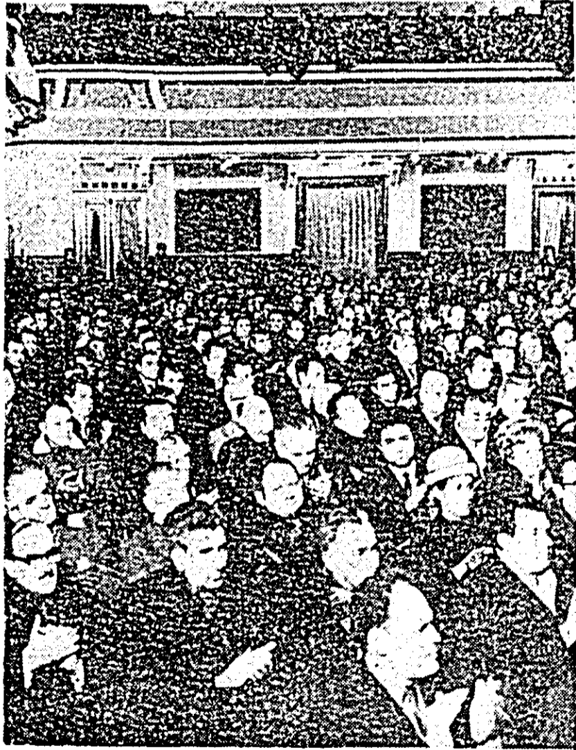
Aspect din sala Palatului cultural în timpul adunării populare de ieri după-amiază.