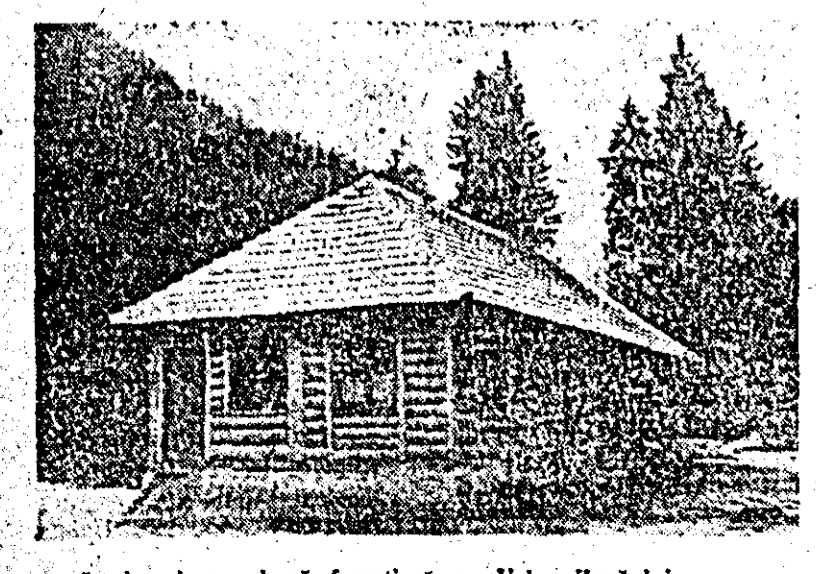
În imagine: cabană forestieră pe Valea Zugăului.