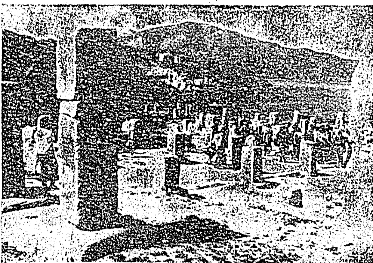
ALGERIA. Vederea din Muzeul în aer liber de la Tipasa, fondat de fenicieni, situat la 70 km vest de Alger. Colonie romană bine cunoscută în sec. I e.n., Tipasa a fost ulterior cucerită de vandali și distrusă. Parcul național Tremaux din Tipasa este astăzi una din principalele atracții turistice, importantă verigă a industriei turistice dezvoltată în Algeria ultimilor ani.