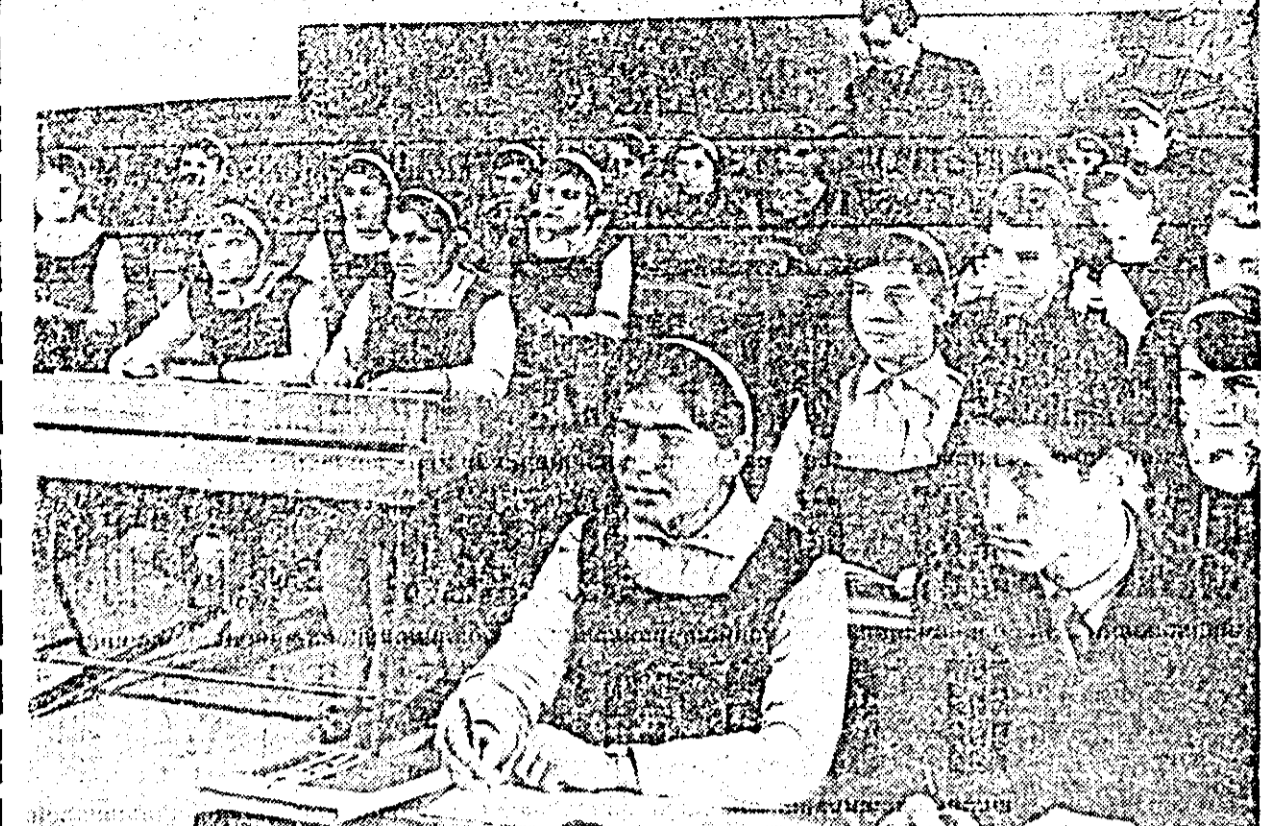
Atenția — o coordonată a reușitei unei lecții. Elevii clasei a X-a C de la liceul din Ineu sint numai ochi și urechi la dezvăluirea unei taine la o oră de fizică.

În loc de obișnuită concluzie, care se poate desprinde din cele de mai sus, reținem cuvintele de-o indiscutabilă veridicitate, formulate de istoric: „Oricum ar fi considerată... Transilvania se dovedește parte integrantă și esențială a pământului și poporului român. Locuită din cele mai îndepărtate timpuri de strămoșii românilor, dacii, apoi de daco-romani și de români, care