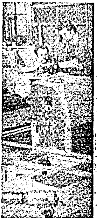
Aspect din atelierul de montaj a întreprinderii de mașini-unelte.