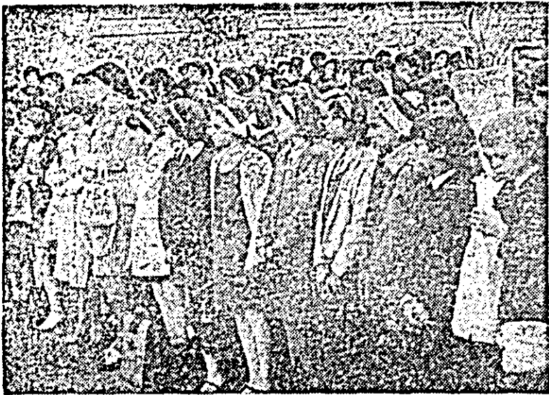
Moment festiv la liceul „Ioan Slavici”.