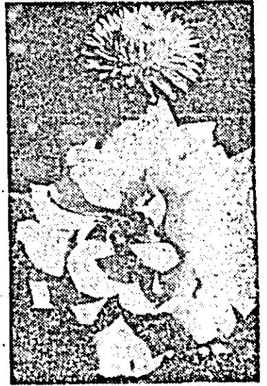
Flori de toamnă.

glabile „MAR-500” — utilaj de înaltă complexitate tehnică, destinat sectoarelor de prelucrare ale industriei constructoare de mașini. • O nouă invenție românească — „Procedeu și agregat complex pentru sudarea simultană a mai multor roți de autovehicule” — se aplică cu succes la întreprinderea de autocamioane din Brașov. Invenția permite folosirea, pentru îmbinarea discului cu jeantă, a unui agregat care sudază simultan mai multe roți, într-un ciclu continuu de fabricație.