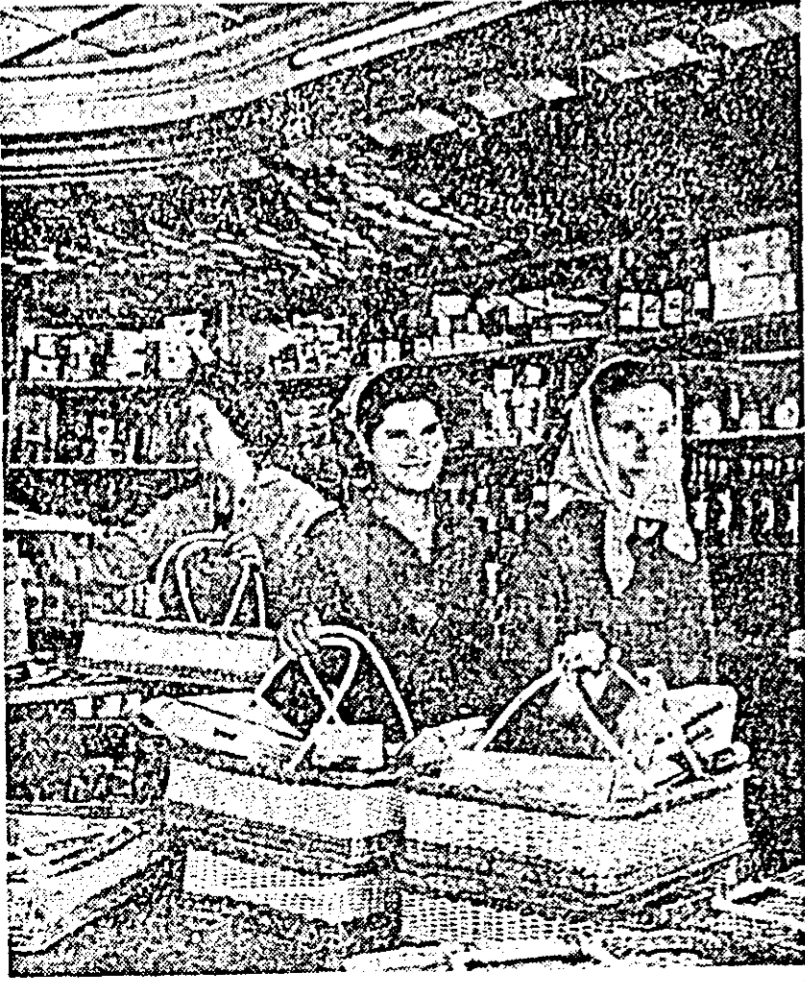
Magazinul cu autodescoperire din comuna Vința cîntăște o mare afliuență de cumpărători. Numai pe luna mai planul de desfacere a produselor a fost depășit cu 32 la sută. În cîșteu: Un aspect din interiorul magazinului.

În general, lucrarea ce se efectuează în prezent în cadrul policlinicii de adulți în orașul nostru și care se va termina la începutul lunii iulie, prezintă mult mai multe îmbunătățiri decît cele arătate mai sus. Un lucru este cert: toate aceste amenajări și transformări pen-