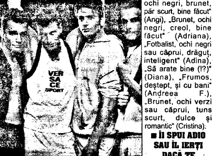
Ce ziceți, fetelor, sunt sau nu ideali?