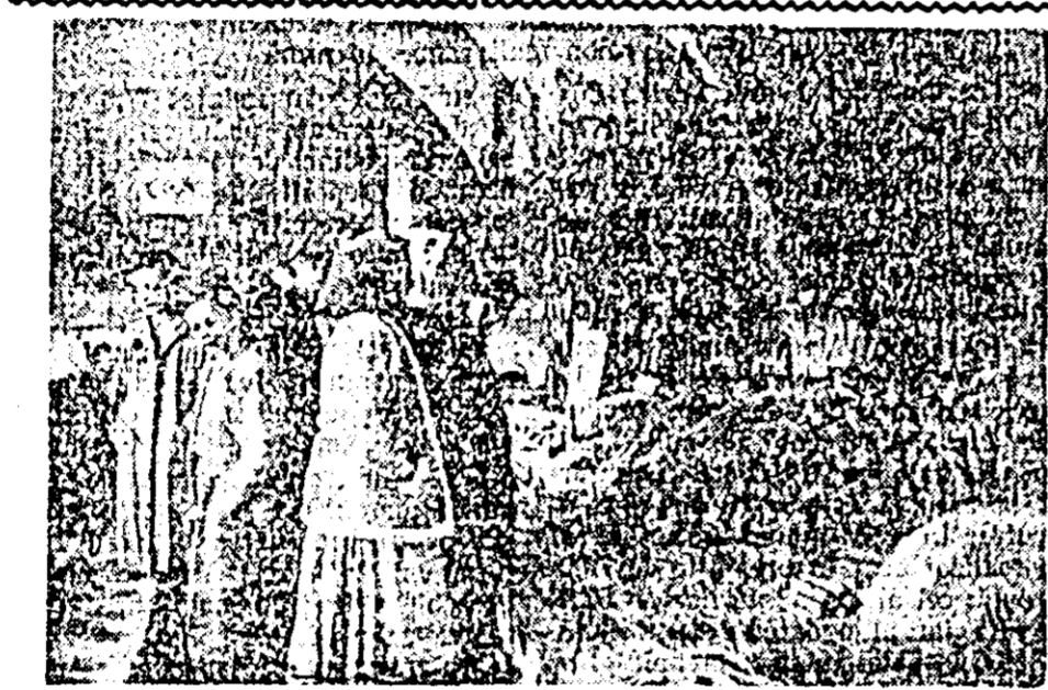
IN CLIȘEU: Un grup de vizitatori în fața unui stand cu porumb, la expoziție.

Felul cum s-a dezvoltat agricultura și cum au lucrat în acest an oamenii muncii de pe ogoarele regiunii noastre e înfrumusețat în mod grațios la Expoziția agro-silvică regională, deschisă de curînd în orașul Arad.