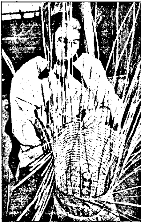
Aceștia vin la Frumuseni pentru a comanda diverse obiecte din răchită.

Ziua Împletitorului e un prilej pentru secția de a încheia contracte cu străinii.