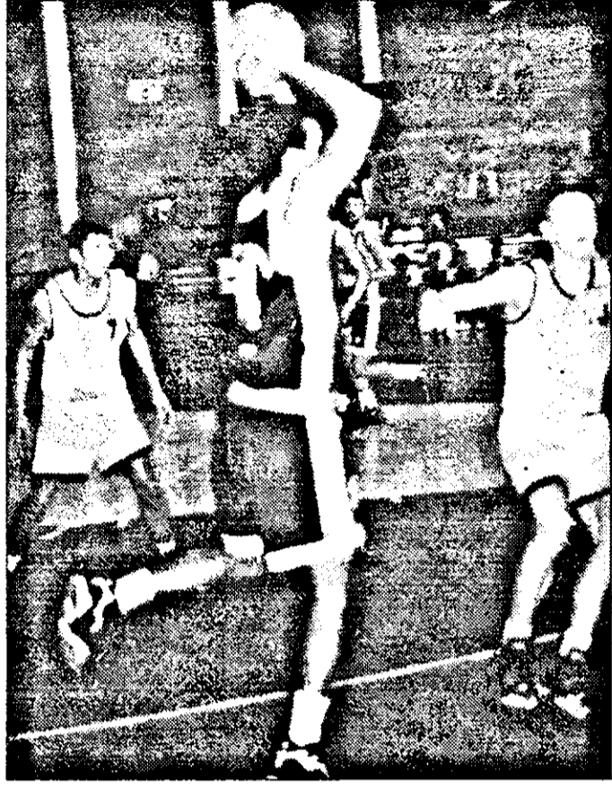
Reușitele lui Sere nu au împiedicat zdrobitorul succes sibian

Ieri, la Sala Sporturilor au avut loc patru dispute contând pentru ultimul tumeu al campionatului Diviziei A de baschet masculin (ziua a doua). Rezultatele înregistrate au fost: ◆ SOCED BUCUREȘTI - SPORTUL STUDENȚESC 62-56 (40-21)