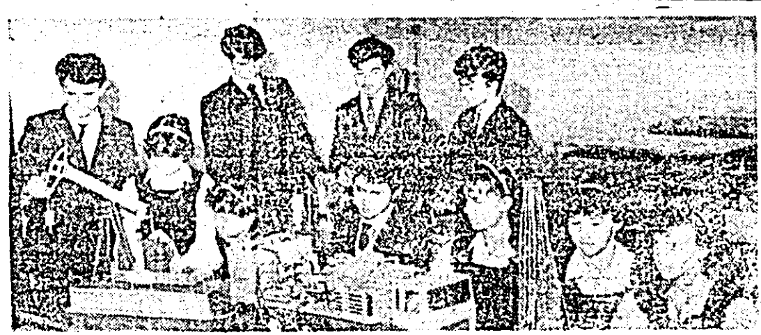
Liceul Industrial nr. 11 Arad cu profil de petrol, un loc al dobîndirii unor meserii prioritare pentru județul nostru.

La Școala nr. 18 din municipiul nostru, documentându-mă deunăzi despre activitățile de orientare școlară și profesională, mi s-a relatat despre un dialog avut de unul dintre dirigintii celor șase clase terminale a VIII-a cu părințele unui elev. El conținea un reproș (și o întrebare) adresat școlii și eforturilor sale în munca de orientare școlară și profesională, care suna cam așa: „Copilul e al meu și-l dau unde vreau! Îi dau dreptul legea să urmeze restul clasei unde vreau? Da - a răspuns dirigintele. După care părintele, crezînd că pune „punctul pe I”, a întrebat ritos: „Atunci de ce-l îngăduiești acest drept?”