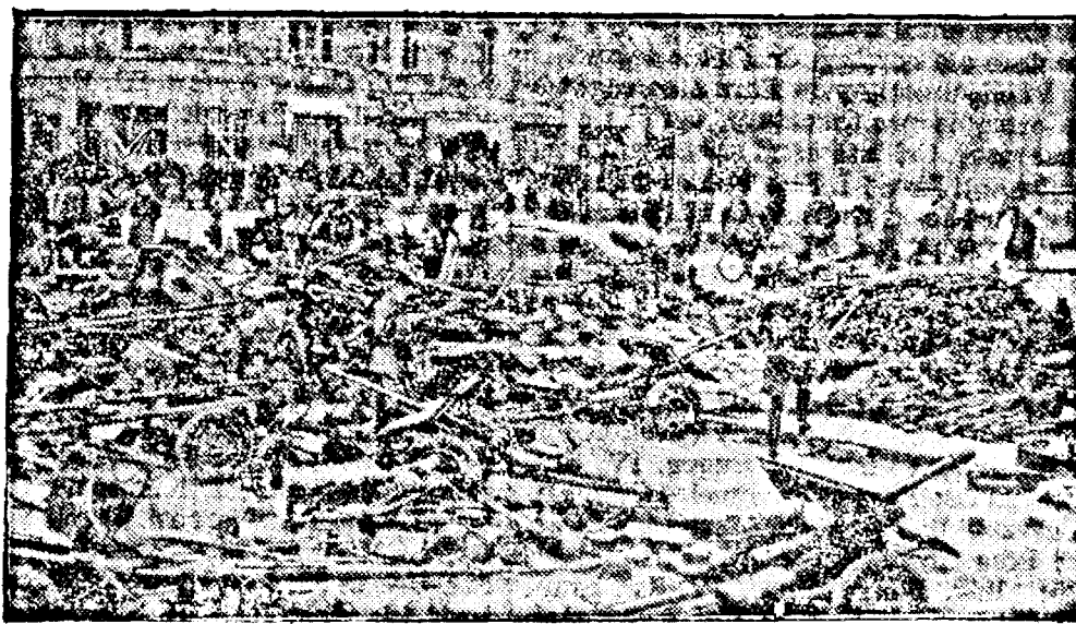
După înșelarea ostilităților