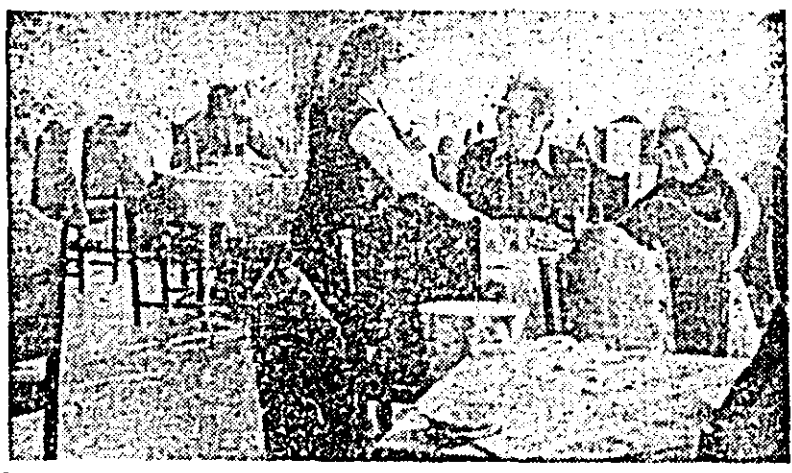
La parterul blocului A 43 din Arad — cartierul Aurel Vlaicu — s-a deschis recent o modernă unitate aparținînd I.C.S.A.P. — „Tic-Tac”.

Casa de Ajutor Reciproc a Pensionarilor din Arad, aduce la cunoștința membrilor săi că, începînd cu data de 3 ianuarie 1980, medicul O.R.L., are pro-gram zilnic, de la ora 11.