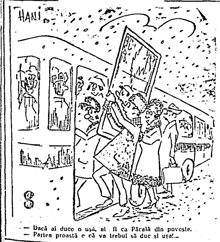
— Dacă ai duce o ușă, ai fi ca Păcală din poveste. — Porțea proastă e că va trebui să duc și ușa!...