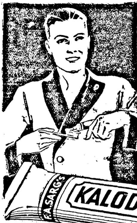
A HABZÓ FOGKRÉM