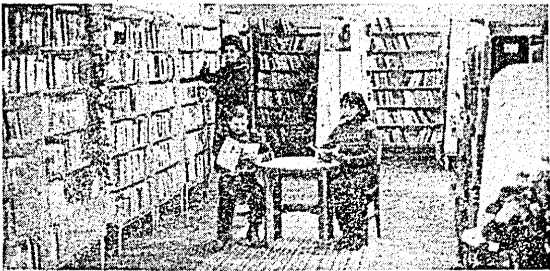
Aspect din noul sediu al Bibliotecii Județene — secția copil.

— Dacă vom reuși să înlocuim în continuare animalele bătrîne și infecunde eu zic că încă din acest an vom ajunge la 85 de viței obținuți de la 100 de vaci și vom realiza integral planul la lapte.