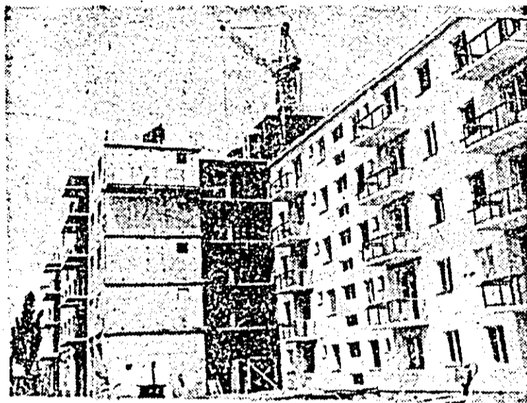
În Piața Aradul Nou, constructorii arădeni de la I.C.M.J. înalță noi blocuri de locuințe care, în final, vor însuma 220 de apartamente.

(Din Expunerea la Congresul consiliilor oamenilor muncii din industrie, construcții și transporturi)