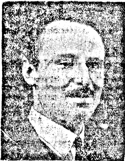
SIR OSWALD MOSLEY

Igy ér el a Labour Partyhoz, az angol munkáspárthoz, amelynek Macdonald a vezetője. A párt, amikor kormányra jut, Mosleyt fő-kormánybiztosnak nevezik ki, feladata a munka-