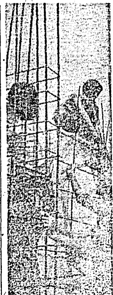
Muncă intensă pe șanti- rul construcțiilor de locuințe din Micalăca.