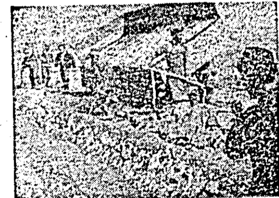
Pentru ca să poată circula spre fermă cu mijloace mecanizate e nevoie de drumuri trainice, pietruite.