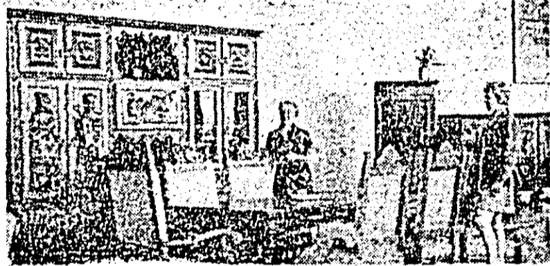
Admirație pentru mobilă arădeană.

Am fost cu gândul, noi cei de acasă, la noul itinerar de prietenie, am aprobat cu entuziasm roadele sale, ne simțim mândri că prestigiul României și al conducătorului său jubilat a crescut cu noi trepte în stima și respectul popoarelor prietene.